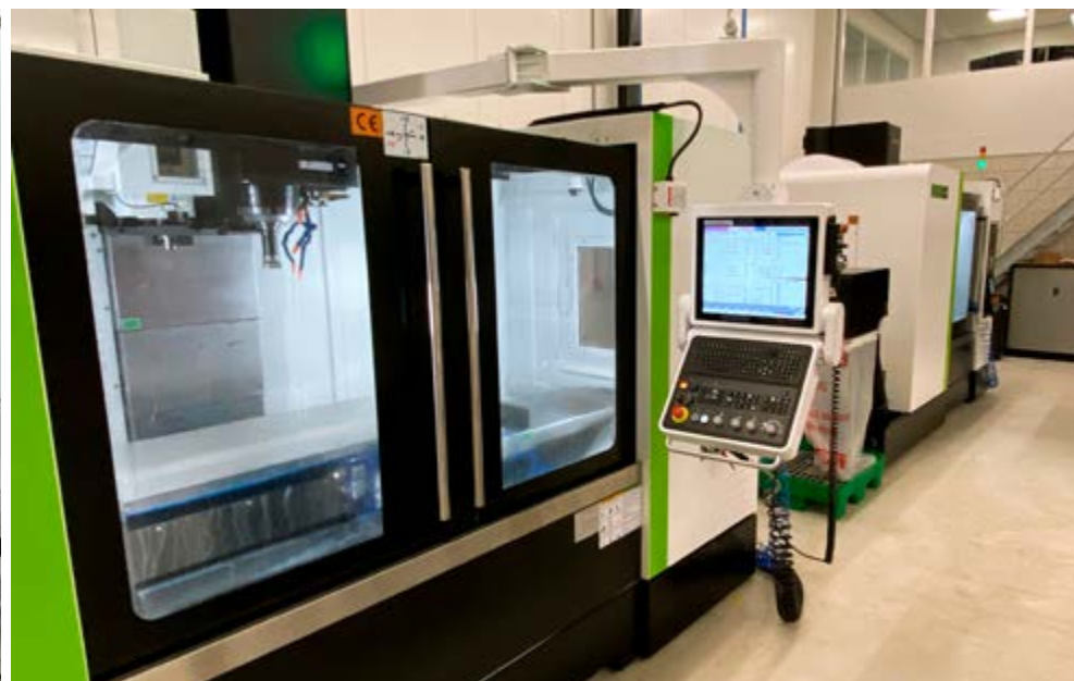
Promas installeerde bij Herikon eerst twee 3-assige Hartford freesbanken.