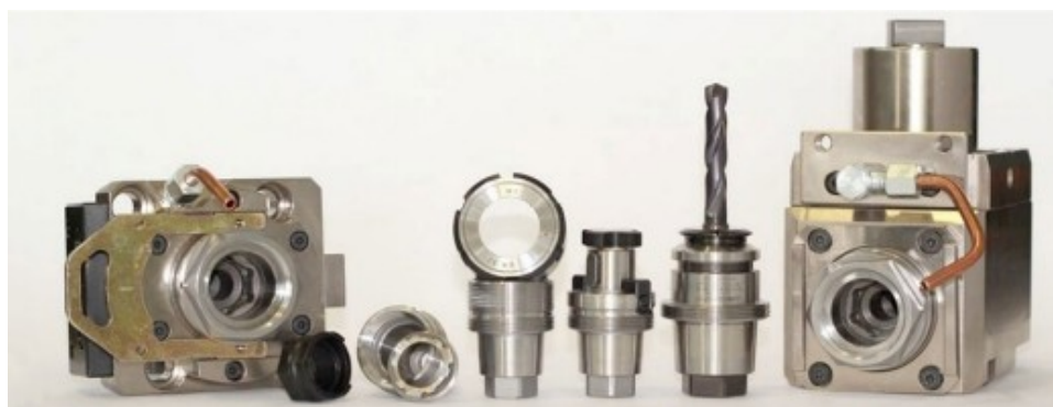
Tooling van MT: het MTSK-snelwisselsysteem