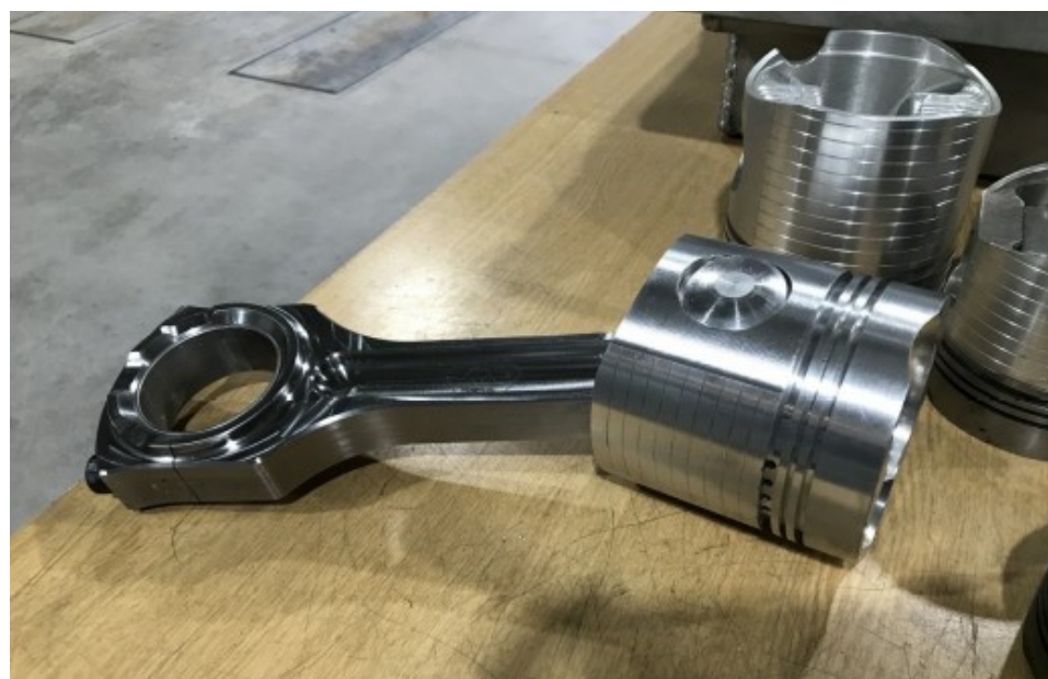
Combinatie zuiger met drijfstaaf voor tractorpulling. Vormgegeven conform klantwens en gemaakt uit billet

een uitstekende testomgeving. Want als je érgens te maken hebt met extreme omstandigheden ten aanzien van belastingen, dan is het wel tijdens het tractorpullen.”